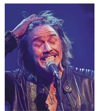
Die Kette mit dem Davidstern-Anhänger trug Gil Ofarim auch beim Comeback-Konzert.

„Man kann nicht die Zeit zurückdrehen. Man kann Zeiten und Sachen, die geschehen sind, nicht verändern. Man will nur aus diesem Alptraum aufwachen“, sagte Ofarim zu seinem neuen Song „Korrektur der Zeit“ – der einzigen Single, die er nach dem Skandal bislang veröffentlicht hat. „Aber man kann trotzdem eins machen: Nicht aufgeben“, fügte er hinzu. Ansonsten spielte er vor allem